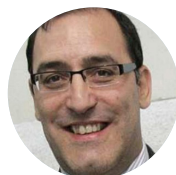
ELOY VELASCO Magistrado- Juez AUDIENCIA NACIONAL